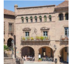
D (zona norte)