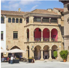
A (zona central)