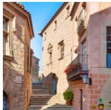
J (zona mediterránea)