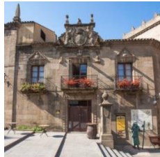
F (zona norte)