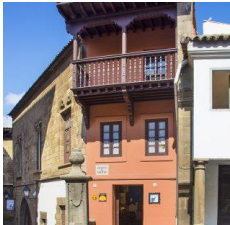
E (zona norte)