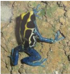
una R ____ venenosa (veneneuse)