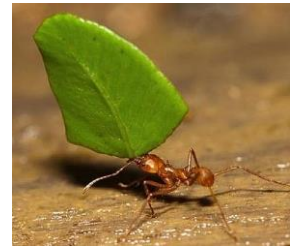
una H ____ cortadora de hoja (trancheuse de feuille)