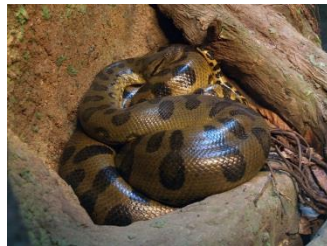
una A _____