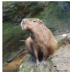
un C _____