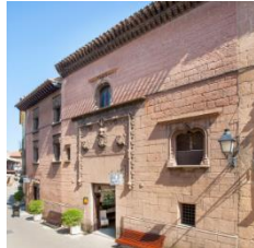
B (zona central)