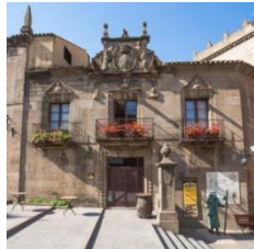
F (zona norte)