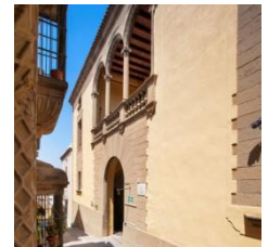
L (zona mediterránea)