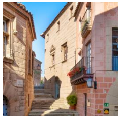
J (zona mediterránea)