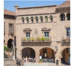
D (zona norte)