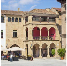
A (zona central)