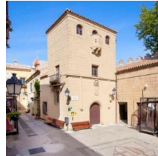
C (zona central)