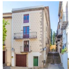
K (zona mediterránea)