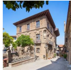
G (zona norte)