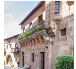
H (zona norte)