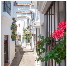
I (zona sur)