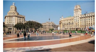
La Plaza de Cataluña